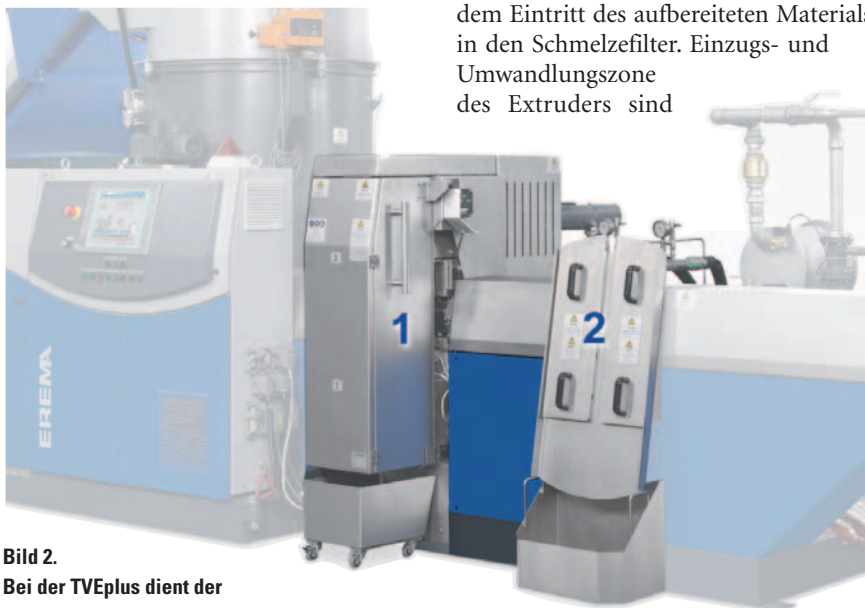
Bild 2. Bei der TVEplus dient der Schneckenabschnitt zwischen vollautomatischem Siebwechsler (1) und Entgasung (2) zur intensiven Schmelzeshomogenisierung

Um Störungen durch nicht beeinflussbare und zudem noch schwankende Fremdkontamination auszuschließen, kam bei den vergleichenden Untersuchungen sauberer Produktionsabfall einer vollflächig und sogar mehrschichtig bedruckten PE-LD-Folie zum Einsatz (Bild 3). Zur Beurteilung der erzielten Regranulatqualität