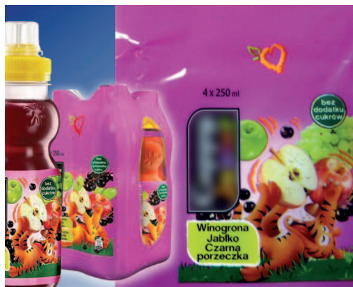
Bild 3. Diese rundum intensiv bedruckte PE-LD-Schrumpffolie kam für die Vergleichsuntersuchungen mit den Recyclinganlagen Erema TE, TVE und TVEplus in unterschiedlicher Schneckenkonfiguration zum Einsatz

weise große Fischaugen auf ( Fall 2 in Bild 4 ). Deren Anzahl ist jedoch erheblich geringer als beim TE-Ergebnis. Fischaugen, allerdings viel kleinere und in nochmals geringerer Anzahl, sind auch in Fall 3 in Bild 4 sichtbar: bei dem Versuchsaufbau TVE mit Dreifach-Entgasung. Hierzu hatte der Extruderzylinder nach dem Filter zwei Entgasungspositionen: Dem in der Normal-Konfiguration eingebauten Doppel-Entgasungsdom war zusätzlich eine Einfach-Entgasung vorgeschaltet. Schneckenengeometrie und Abstand der beiden Entgasungsstellen waren so gewählt, dass ein komplett mit Schmelze ge-